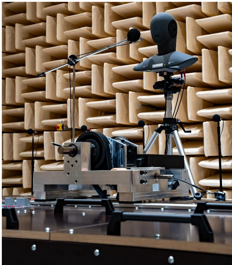
Abbildung 3 Bewertung der DriveUnit

Gerade im Premium- und E-Bike-Segment, in dem leiser Lauf und hochwertige Anmutung kaufentscheidend sind, wird Akustik zunehmend zum Differenzierungsmerkmal.